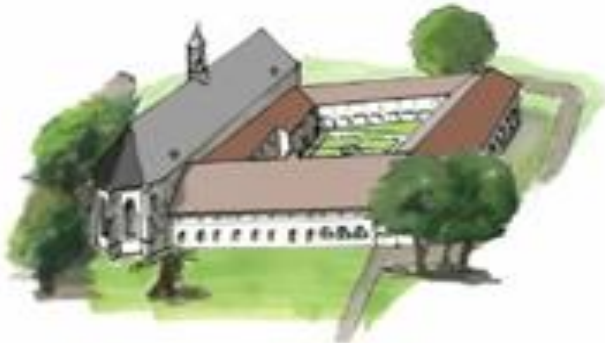
Kloostercomplex Ter Apel

Een belangwekkend cultuurhistorisch ankerpunt in de zuidpunt van het esdorpenlandschap van Westerwolde vormt het klooster van Ter Apel dat in 1464 door de Kruisheren is gesticht. Het kloostergebouw heeft na de Reductie gediend als voorpost voor de stad Groningen, de toenmalige eigenaar van de Heerlijkheid Westerwolde, en is grotendeels bewaard gebleven.