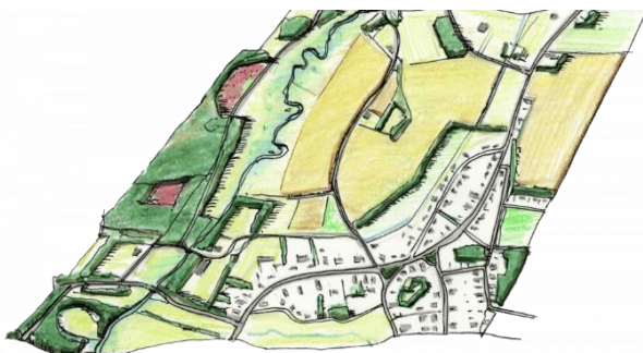
Spinnenwebstructuur bij Onstwedde

Een mooi voorbeeld van de esdorp-opbouw is het dorp Onstwedde. Kenmerkend voor dit dorp is de ligging aan de rand van het beekdal van de Mussel Aa en het spinnenwebachtige patroon van wegen en paden. Vanuit het centrum, met vaak een verruiming van de openbare ruimte (de brink), lopen wegen naar de verschillende onderdelen van het dorp. Deze wegen vinden hun oorsprong in het bewerken van het land: ze verbonden vroeger het bouwland, de weiden en de woeste gronden met elkaar. Lange tijd bestonden deze wegen nog uit zandpaden. Een duidelijke hiërarchie in wegen ontbreekt en het verloop is vaak zeer bochtig. Aan de Juffertoren van Onstwedde is een sage verbonden die de naam van de toren herleidt. Er waren oorspronkelijk vier Juffertorens in Groningen, alleen die van Onstwedde en Schildwolde bestaan nog. Ze karakteriseren zich door de volledig uit baksteen opgetrokken toren en spits.