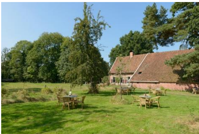
Theehuis te Smeerling, voorbeeld kop-romp type

Naast dat het ontgonnen land voor agrarisch gebruik werd ingericht, werden met name bij Sellingen in de jaren '30 tot en met '50 van de 20 ste eeuw bossen geplant op de heidevelden.