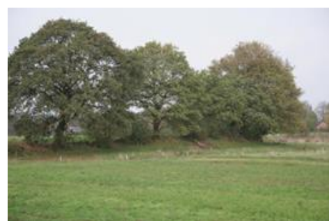
Es met steilranden bij Sellingen